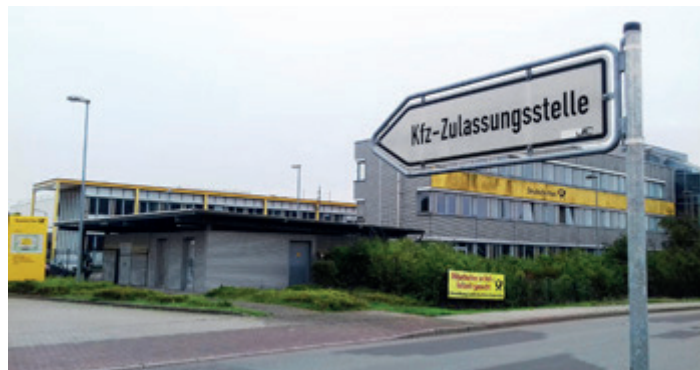
Die Kfz-Zulassung ist in das Post-Logistikzentrum umgezogen.