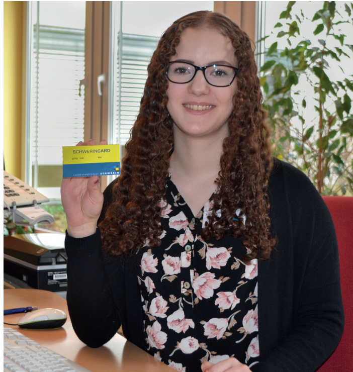
Die gelb-blaue Schwerin-Card ist im Bürgerbüro des Stadthauses erhältlich.

Die Schwerin-Card berechtigt zur vergünstigten Nutzung verschiedener Kultureinrichtungen, die sich in Trägerschaft der Landeshauptstadt befinden. So erhalten ihre Inhaber im Volkskundemuseum, in der Volkshochschule und Sternwar-