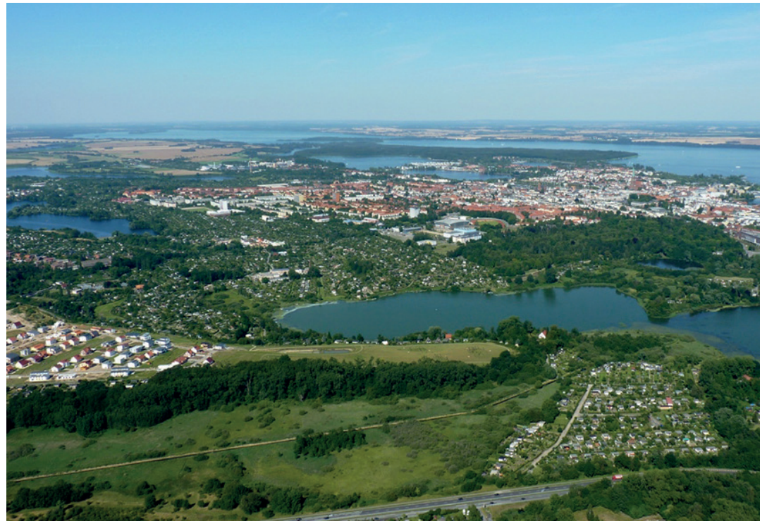
Schwerin ist eine Stadt der Kleingärten: Pro Einwohner gibt es 37 m 2 Gartenfläche.

Vier Leitziele will die Stadt dabei verfolgen: Neben der Sicherung eines nachfragegerechten Kleingartenbestandes in der Stadt betrifft das den Abbau von Nutzungskonflikten. Die Freiraumfunktion und die ökologische Ausgleichfunktion der Kleingärten soll verbessert, die kleingärtnerische Nutzung gerade bei jungen Menschen und Familien