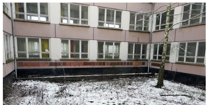
Vor dem Startschuss für den Abriss der Karl-Marx-Schule wurden die so genannten Ehrentafeln abgebaut und eingelagert.

Parallel zum beginnenden Abriss wird die Containeranlage der John-Brinckman-Schule in der Woche nach Ostern (3.04. - 06.04.2018) demontiert