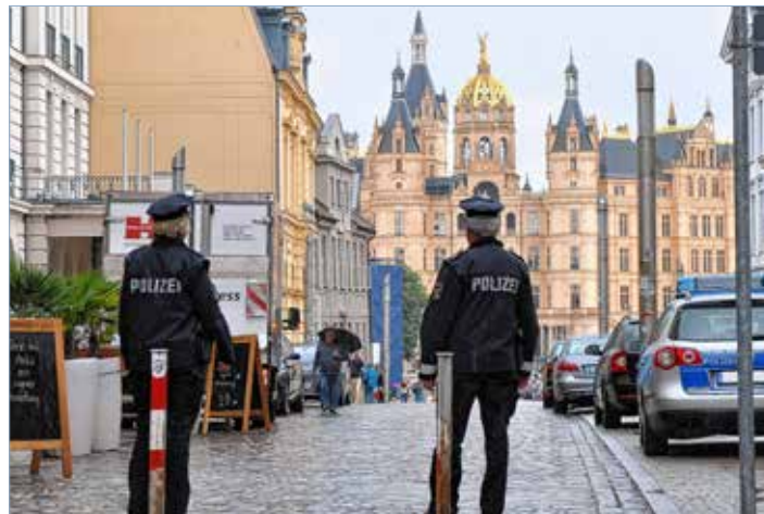
Auch in der Schlossstraße gelten nun geänderte Polleröffnungszeiten.