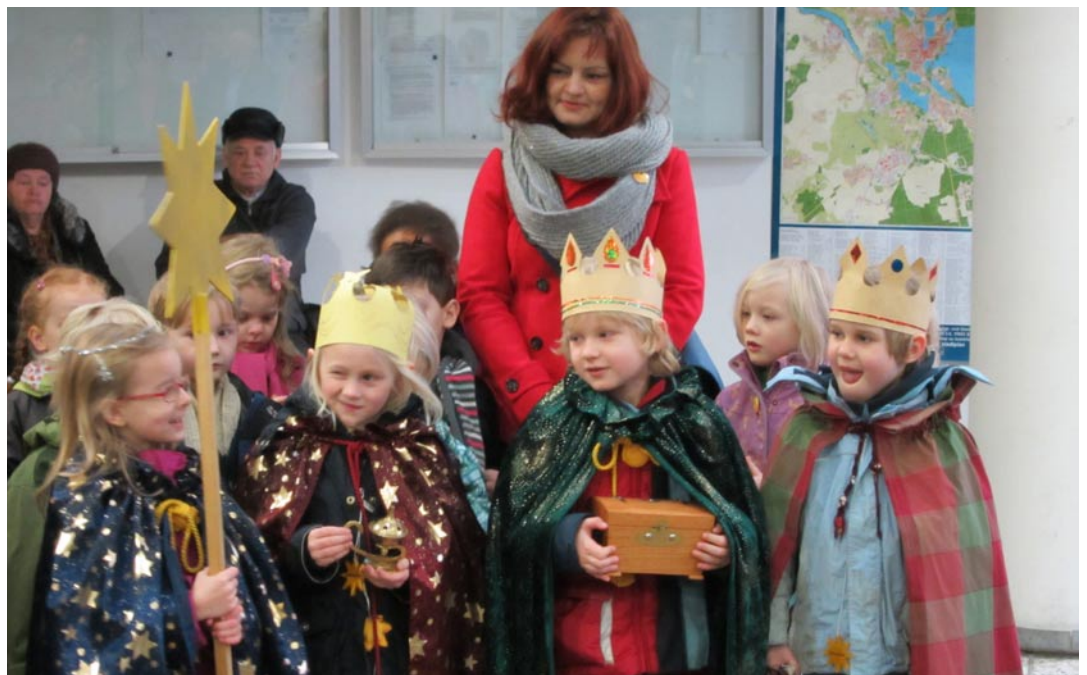
Sternsinger der Kindertagesstätte der Katholischen Kirche St. Anna brachten nach altem Brauch den Segen Gottes und die friedensbringende Botschaft von Bethlehem ins Stadthaus.

Die gesammelten Spenden sollen helfen, die medizinische Betreuung von Kindern zu verbessern.