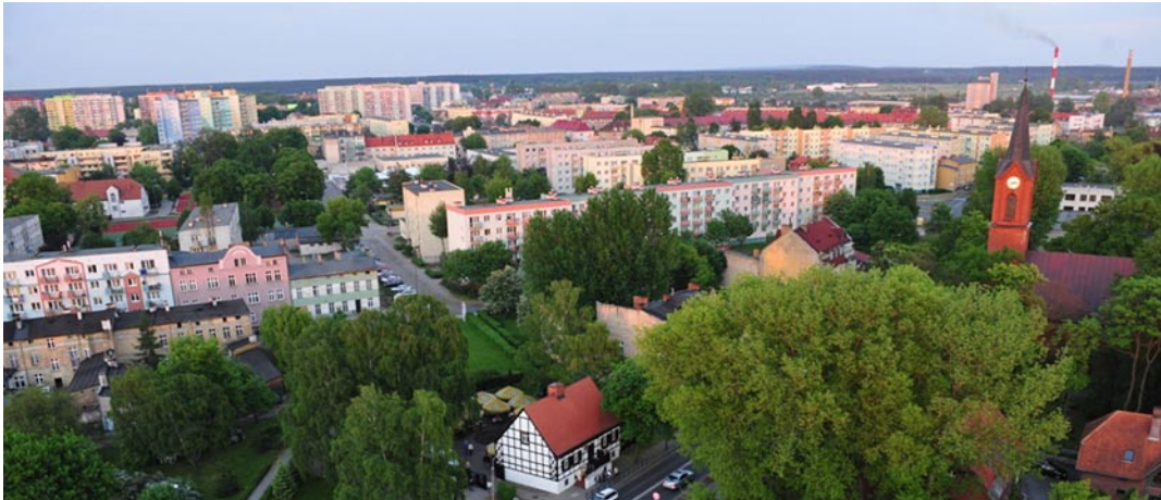
Stadtsicht Pila