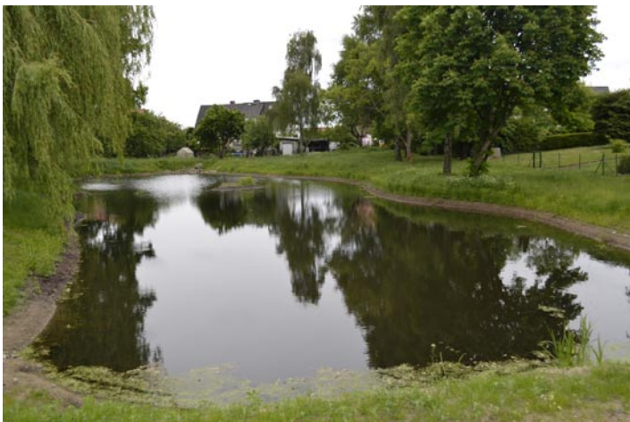
Natur pur im Stadtteil Neumühle: Das renaturierte Immensoll.

Was wollen Kinder und Jugendliche in ihrem Stadtteil? Wer kann das besser beurteilen als sie selbst. Die Stadt plant zusammen mit dem Trägerverbund III eine Beteiligungswerkstatt unter dem Motto „Spilleitplanung“ mit Kindern und Jugendlichen aus Neu Zippendorf und dem Mueßer Holz. Stadtplaner Reinhard Huß: „Die Spilleitplanung bietet einen Handlungsrahmen für die konzeptionelle Entwicklung der beiden Stadtteile aus der Sicht von Kindern, Jugendlichen und Familien. Sie ist nicht eingegrenzt auf die Gestaltung von Spielplätzen, sondern erfasst und bewertet alle öffentlichen Freiräume, in denen sich Kinder und Jugendliche aufhalten.“ So soll mit der Jugendbefragung festgestellt werden, wo sich junge Leute gerne aufhalten und treffen, welche Gefahrenstellen oder Angsträume sie sehen und wie Veränderungen herbeigeführt werden können. Die Jugendlichen sollen selbst Experten in ihrem Stadtteil sein. „Ziel ist es, die Lebensqualität der Kinder und Jugendlichen in ihren Stadtteilen zu erhöhen“, erklärt Ursula Gebert, Sozialpädagogin des Jugendamtes. Unterstützt wird das Projekt mit Geldern aus dem Programm „Soziale Stadt“.