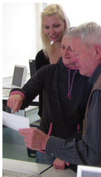
Wird gut angenommen: die Außenstelle der VHS im Mueßer Holz.

„Die Volkshochschule ist ein unverzichtbarer Baustein der Bildungslandschaft in der Landeshauptstadt.