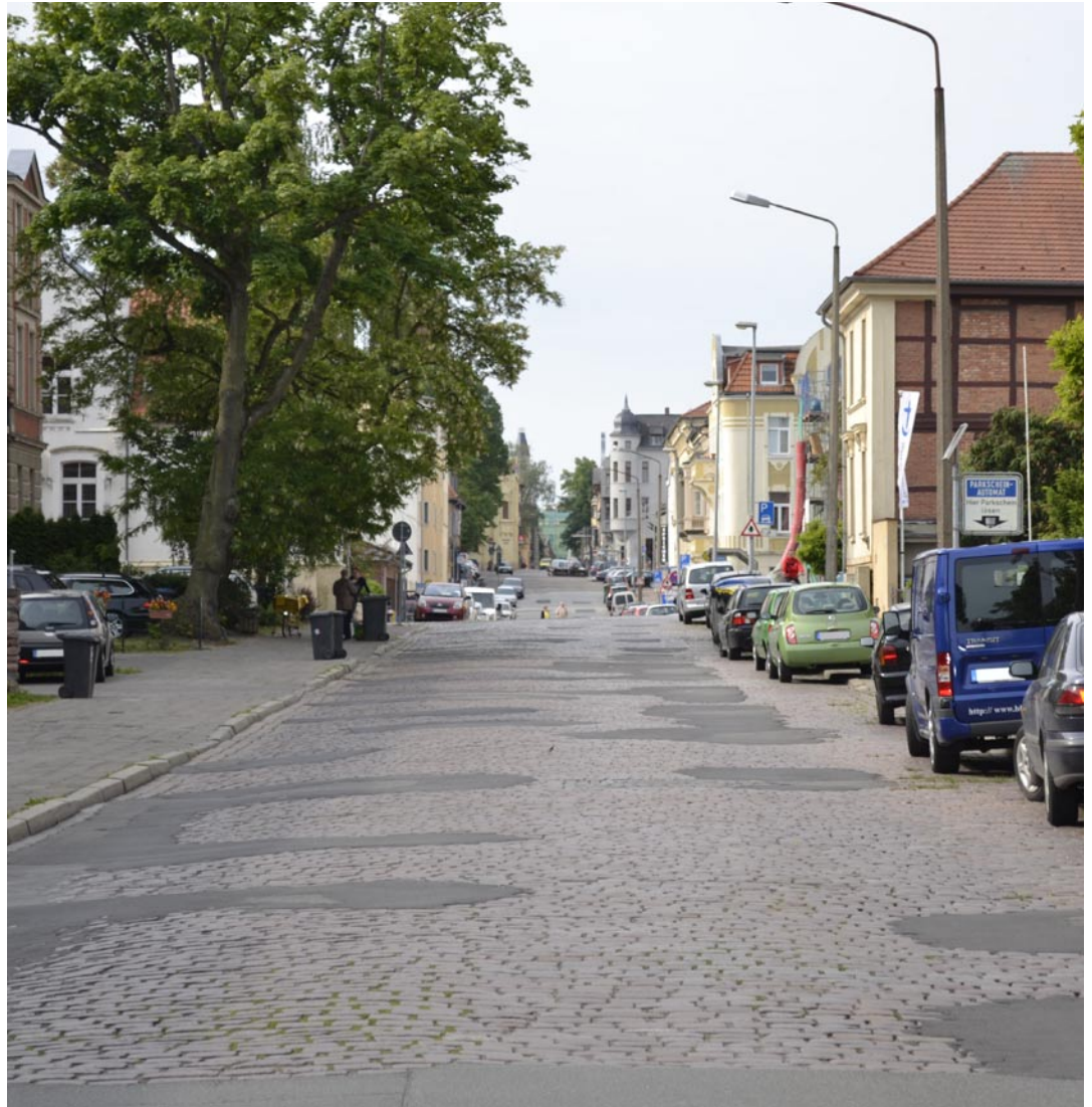
Die Sanierungsarbeiten des Eingangstores der Schelfstadt sollen im kommenden Jahr beginnen. Fahrbahn, Parkstreifen, Gehwege und Beleuchtung werden erneuert.

Die Fahrbahn der Bergstraße wird auf 3,80 Meter verbreitert, damit sich in Zukunft Pkw- und Radfahrer problemlos begegnen können. Rechts und links werden neben der Fahrbahn Längsparkstreifen gebaut. Die Oberfläche im 1. Bauabschnitt der Straße wird mit den vorhandenen Granitpflastersteinen verlegt. Die Fahrbahn des 2. Bauabschnittes erhält eine Asphaltdecke. Die Parkstreifen werden mit Granitkleinstpflaster ausgestattet, die Gehwege gelb geklinkert. Mit der Sanierung erhält die Straße auch eine neue Beleuchtung. Dafür sind die in der Schelfstadt typischen Promenaden-