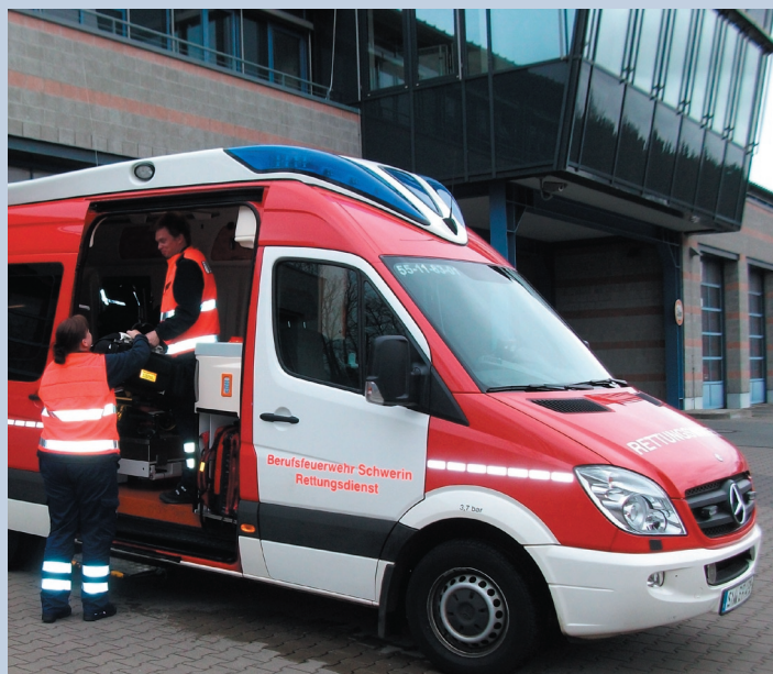
Rettungsassistenten der Schweriner Berufsfeuerwehr bei ihrer Arbeit.

Stadtverwaltung Schwerin Amt für Hauptverwaltung Abteilung Zentrale Steuerung, Organisation, Personal PF 11 10 42 19010 Schwerin