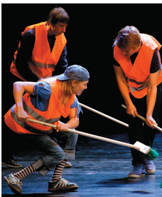
Schüler von ATARAXIA mit ihrer Show „Stomp“.

Am Finaltag, dem 31. März, erwartet die Helferinnen und Helfer auf dem