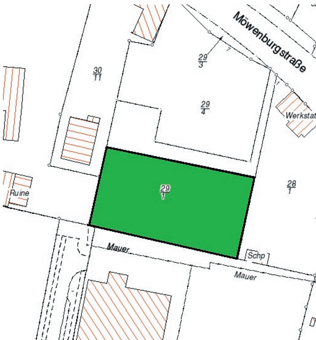
Lageplan der unbebauten Teilfläche aus dem städtischen Flurstück 29/1 der Flur 19, Gemarkung Schwerin

Dieses und weitere Grundstücksangebote der Stadt Schwerin finden Sie auch unter www.schwerin.de/immobilien .