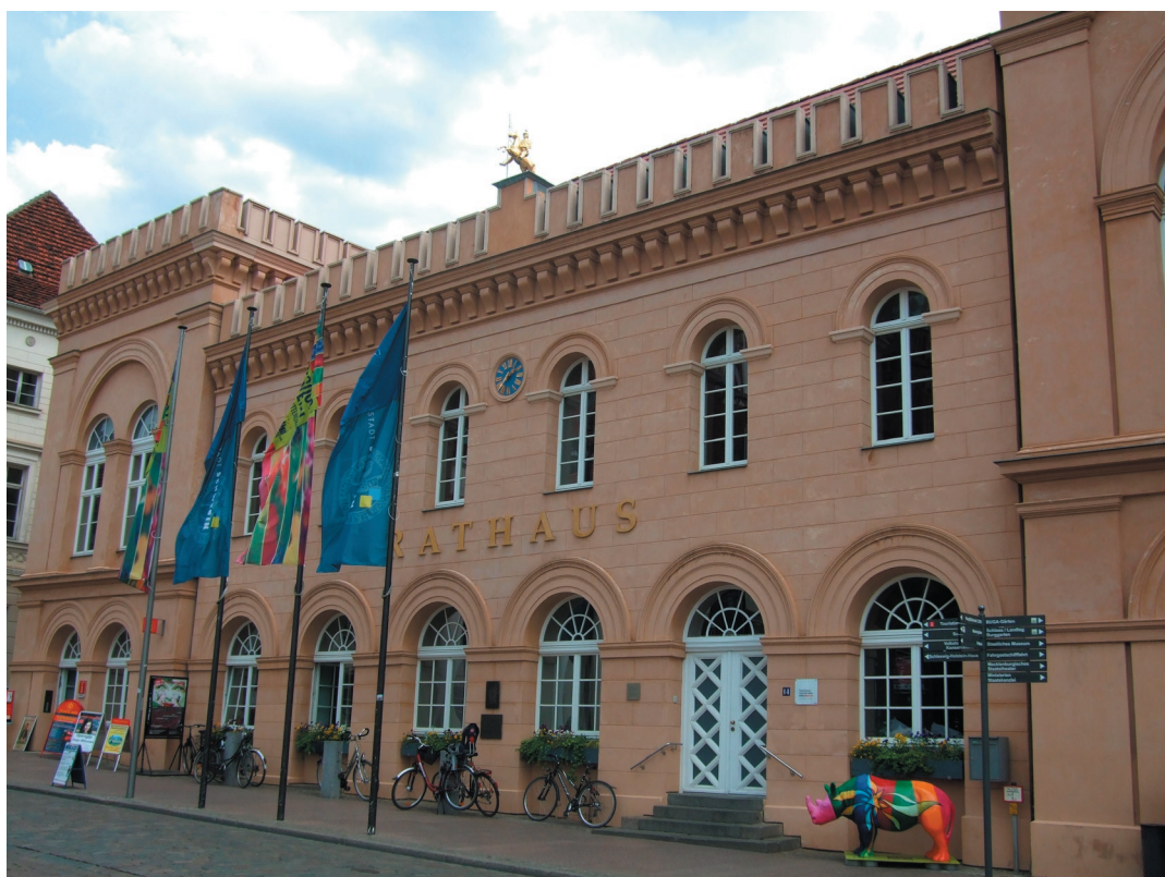
Sitzungsort der Stadtvertretung ist der Demmlersaal des Rathauses.